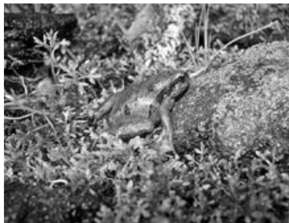
Fig. 2. Ejemplar de Eupsophus calcaratus colectado en bahía James (48°59' S, 74° 26' W), isla Wellington.

La especie fue descrita en base a ejemplares colectados en isla Wellington (Formas et al. 1997) y